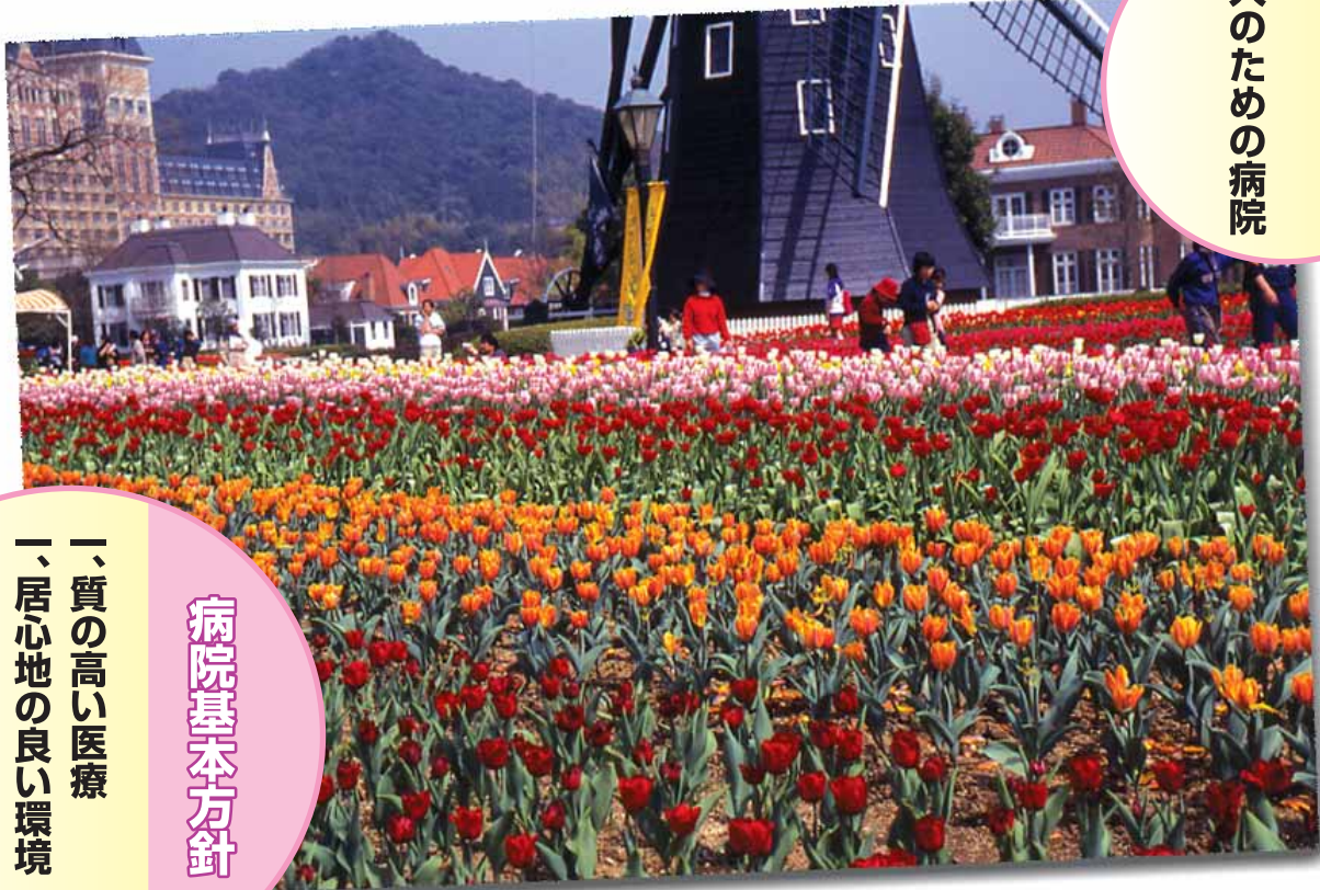
作品:写真部提供(田中満行「ハウステンポスチューリップ祭」)