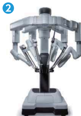
ペイシェントカート