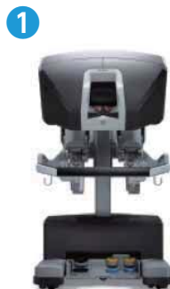
サージョンコンソール