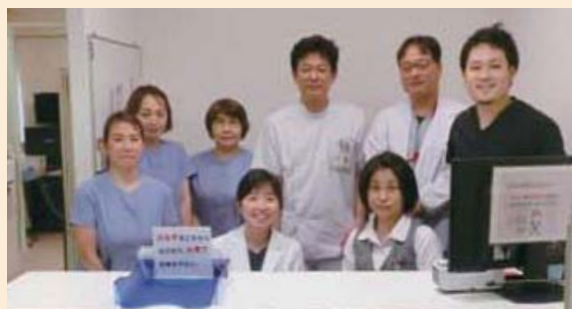
内視鏡センター スタッフ

これまでは健康管理センターと内視鏡センターが離れていたため、健診での内視鏡検査の際にご不便をおかけしておりましたが、本館2階の健康管理センター横に移転し、健診や内科外来からの内視鏡検査の際のアクセスが改善しました。