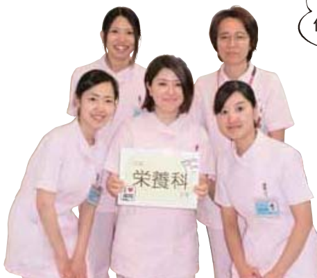
管理栄養士スタッフ

身体だけではなく、心にも「美味しい」「楽しい」「嬉しい」食事提供をしていくことが私たちの課題です。環境改善に甘んじることなく、患者さんやご家族にさらに喜んでいただけるように取り組んでいきたいと思えます。