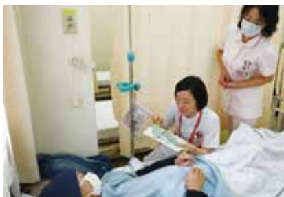
外来化学療法室での様子

A 抗がん剤には、がん細胞を攻撃する働きがあります。しかしその作用は、がん細胞だけでなく正常な細胞も傷つけてしまい、これが脱毛や吐き気などの副作用となることがあります。最近では、抗がん剤の副作用を和らげるための治療法(支持療法)の進歩により、副作用と上手に付き合いながら治療が続けられるようになってきました。また、ある特徴をもったがん細胞を攻撃する「分子標的薬」と呼ばれる薬の中には、脱毛や吐き気などの副作用が比較的少ないものもあります。