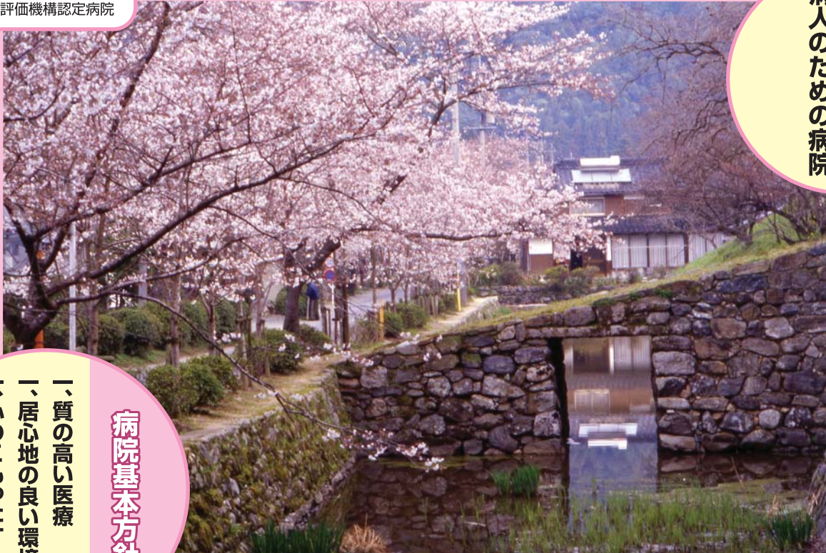
作品：写真部提供（米倉 礼子「秋月の桜並木」）