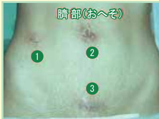
図1 下腹部3カ所の傷口(①~③)

急性虫垂炎は、適切な時期に、適切な治療を行うことが大事です。詳細につきましては、外科外来までお気軽にお尋ね下さい。