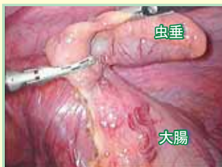
図2 腹腔内で虫垂を切除