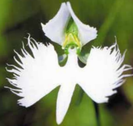
作品：櫻原湿原（細川 勝子「さぎ草」）